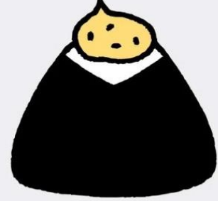
ツナマヨ 400 円