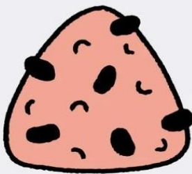
寝かせ玄米 350 円