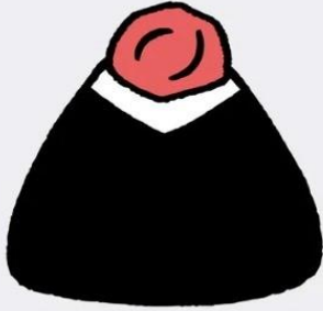
すっぱいうめ 400 円