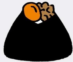
卵黄肉そぼろ 500 円