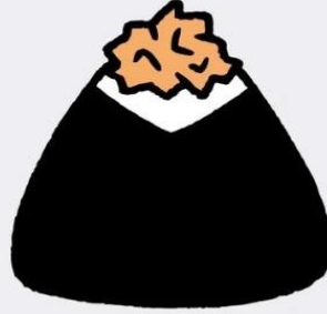
塩麴しゃけ 400 円