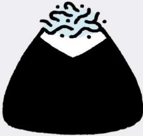
しらすごま 400 円